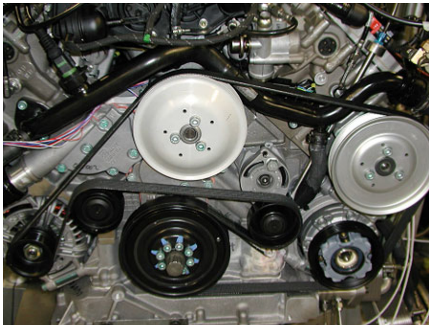
自動車用補機駆動システムの実施例 AUDI V6 2,4l